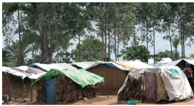
Die Kolonialzeit und unzählige Konflikte haben Not, Elend und Hoffnungslosigkeit hinterlassen.

Der Kongo litt von 1908-1960 unter belgischer Kolonialherrschaft. Kürzlich erinnerte sogar der israelische Premierminister an die dramatischen und inhumanen Verhältnisse der damaligen Zeit, als er vor dem amerikanischen Kongress sagte: „Wir sind nicht die Belgier im Kongo!“ Vorübergehend hatten einheimische Führer, wie Patrice Lumumba Emery, im Anschluss an die Kolonialzeit die Macht übernommen. Doch Col. Joseph Mobutu putschte sich an die Präsidentschaft, änderte den Namen des Landes in Zaïre und herrschte 32 Jahren mit brutaler Gewalt. Seine Diktatur ließ das Land im Chaos zurück. 1994 verschlimmerte sich der Zustand durch den massiven Zustrom von Flüchtlingen nach dem Völkermord in Ruanda. Zuerst beendete Laurent Kabila mit Hilfe von ruandischen und ugandischen Armeen das Mobutu-Regime, dann wandten sich die Armeen gegen ihn und führten 1998 das Land in einen Katastrophenzustand,