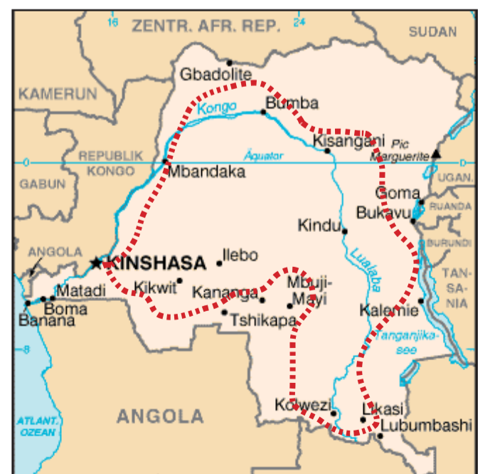
Die Planung der „Vote for Hope“-Tour.